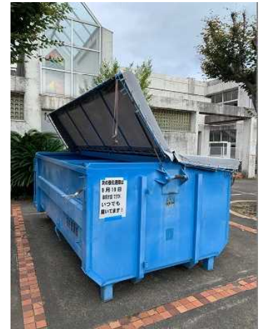
昇降口前の回収ボックス

9 / 19(体育大会) 10 / 29～11 / 6 (教育相談・三者面談・授業参観等) 12 / 9～15(三者面談) 1 / 29(3年進路説明会) 2 / 18(1・2年授業参観)